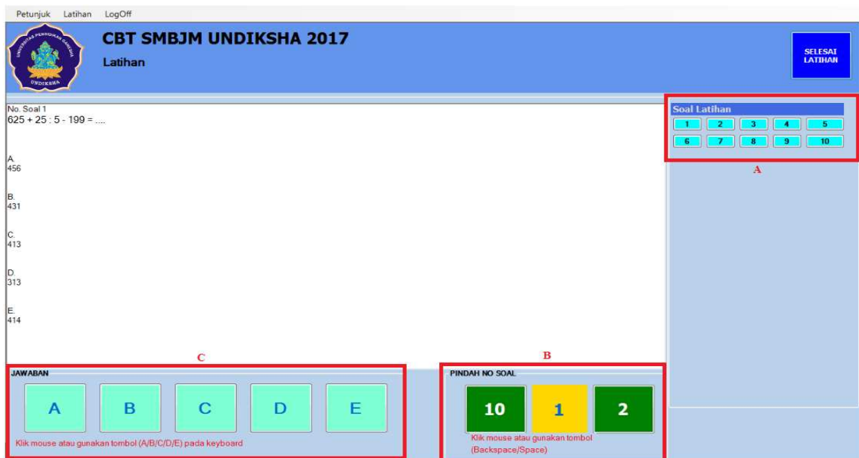
Gambar 3. Latihan Tes CBT

Ketika tombol mulai “ MULAI ” pada halaman utama sudah di klik maka aplikasi akan menghitung mundur waktu, yang dapat dilihat pada fitur batas waktu. Apabila peserta tes telah selesai mengerjakan seluruh soal pada tes, peserta dapat menekan tombol selesai “ SELESAI ” untuk mengakhiri tes pada ujian SMBJM.