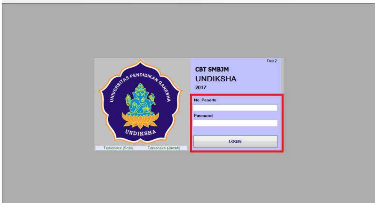
Gambar 1. Login Sistem